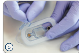
⑤ Schutzdeckel für Einheitschraube abnehmen