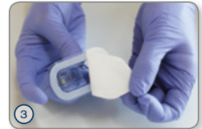
③ Tyvek-Folie des Innenblisters abziehen