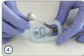
④ Eindreheschlüssel direkt ins Implantat einführen und entnehmen