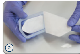
② Tyvek-Folie des Außenblisters abziehen und Innenblister entnehmen