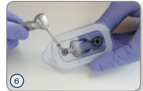
⑥ Einheitschraube mittels Eindreheschlüssel entnehmen